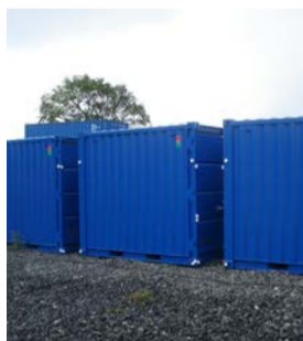
Lagercontainer, 10 ft, NEU, € 2.250,-