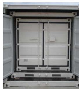
Lagercontainerpaket, 6 ft, 8 ft, 10 ft, NEU, € 5.000,-

Solange der Vorrat reicht. Alle Preise verstehen sich netto.