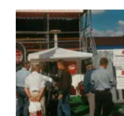
1997 IMMER MOBIL: SANI freut sich über viele neue Aufträge und über das große Kundeninteresse auf der Nordbau.