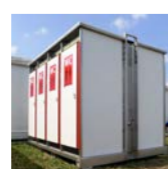
1999 MIT ROCK IM PARK etabliert sich SANI endgültig als Spezialist für Groß-Events – und mit Polizeieinheiten beim Castortransport als Anbieter für Container.