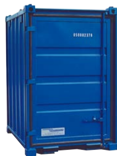
Mover-Box, brandschutzgeprüft, NEU, € 1.650,-