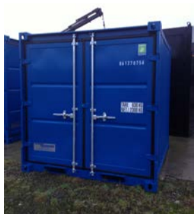
Lagercontainer, 8 ft, NEU, € 1.920,-

Bei Interesse könnt ihr uns direkt anrufen und einen Termin vereinbaren.