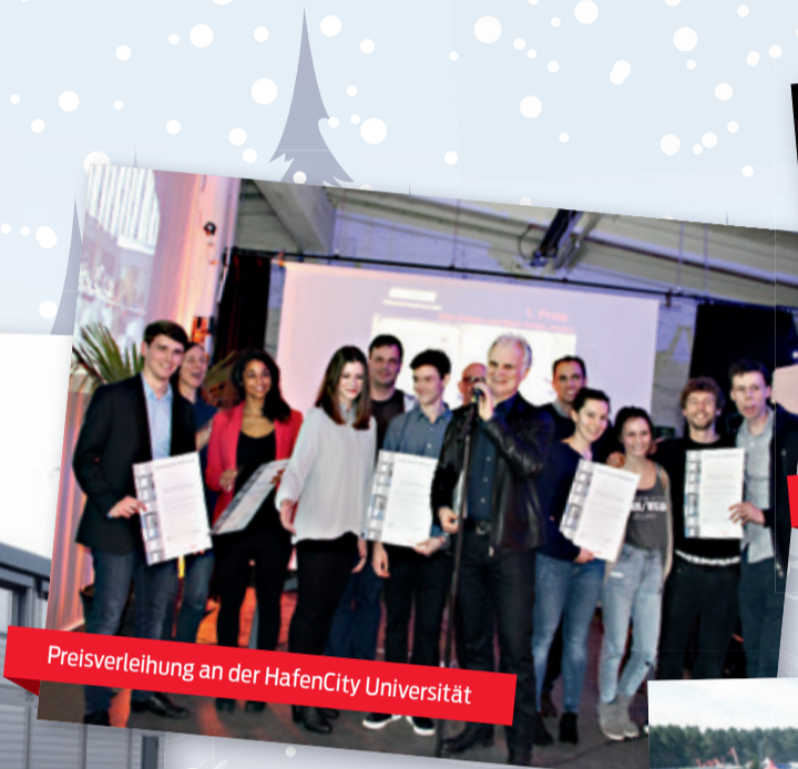
Preisverleihung an der HafenCity Universität