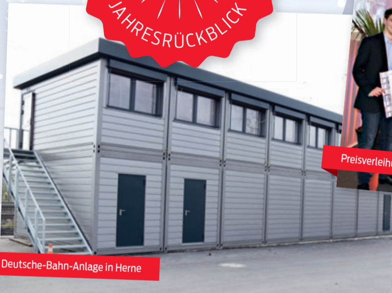
Deutsche-Bahn-Anlage in Herne