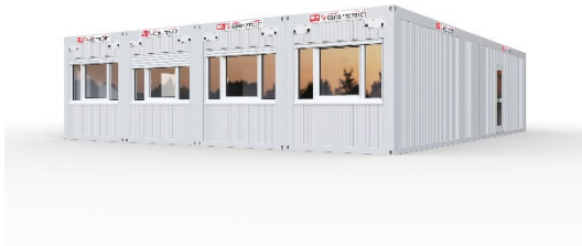
SANI-Standard 1-Gruppen-Kita für 15-20 Kinder

SANI-Standard: Unsere Standard-Kitas zur Miete oder zum Kauf mit hellen Räumen, prima Raumklima und -akustik, kindgerechten Sanitäre Lösungen und Sicherheitspaket.