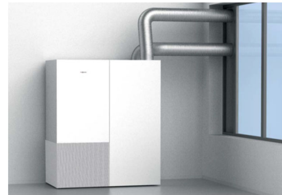
Luftreinigung & Lüftungs-System