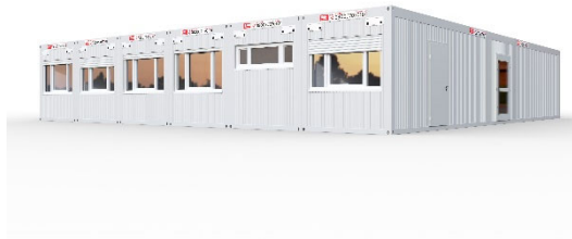
SANI-Standard 2-Gruppen-Kita für 30-40 Kinder