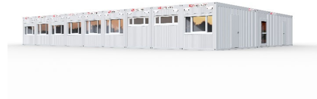
SANI Standard 3-Gruppen-Kita für 45-60 Kinder